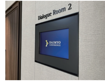
22inch 横型ディスプレイ