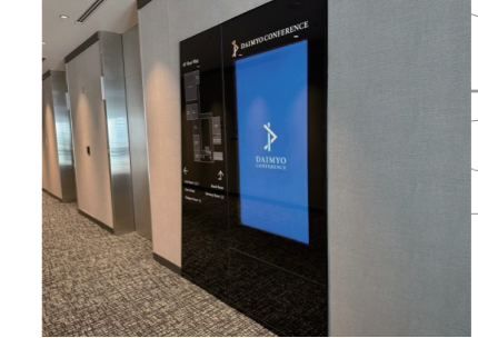
55inch 縦型ディスプレイ