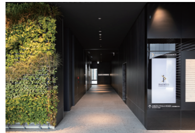
55inch 縦型ディスプレイ