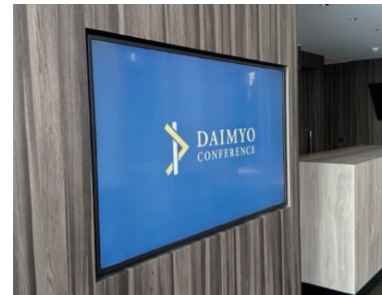
55inch 横型ディスプレイ